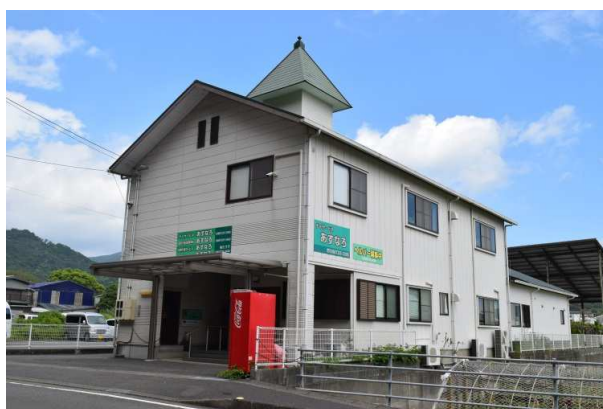
国道から入ってすぐの通いやすい場所です。