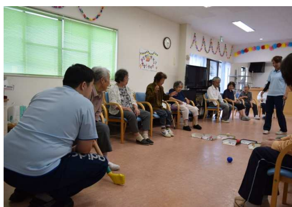
利用者さんとのゲームの企画や実施も行います。