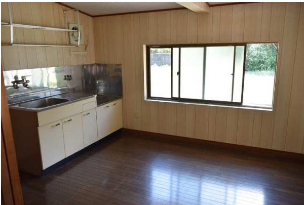
共同キッチン(6畳程度)