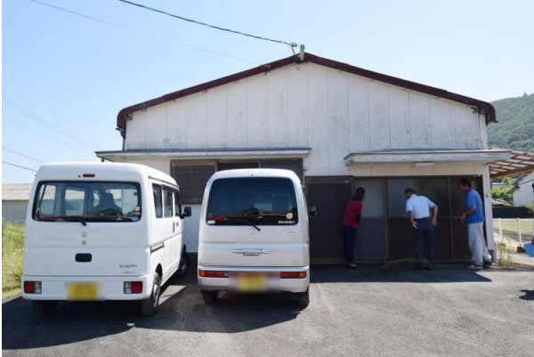
駐車スペースあり